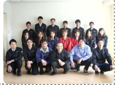
新メンバーの集合写真です